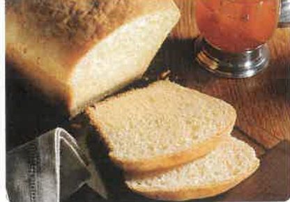
Pão de forma