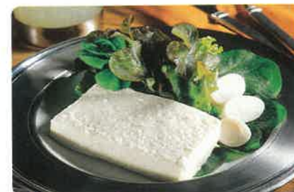
Musse de palmito