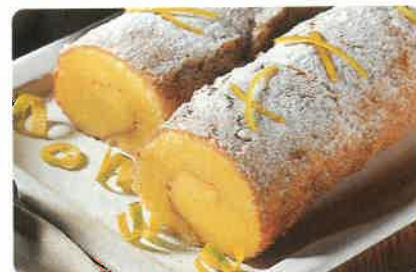
Rocambole de laranja