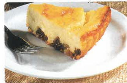
Torta de ricota