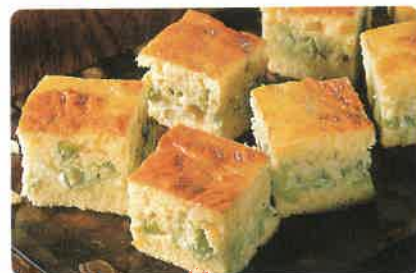
Torta de alho-poró